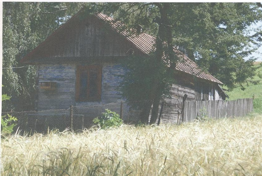
Pozostałości dawnej zabudowy mieszkalnej w miejscowości Krzywystok