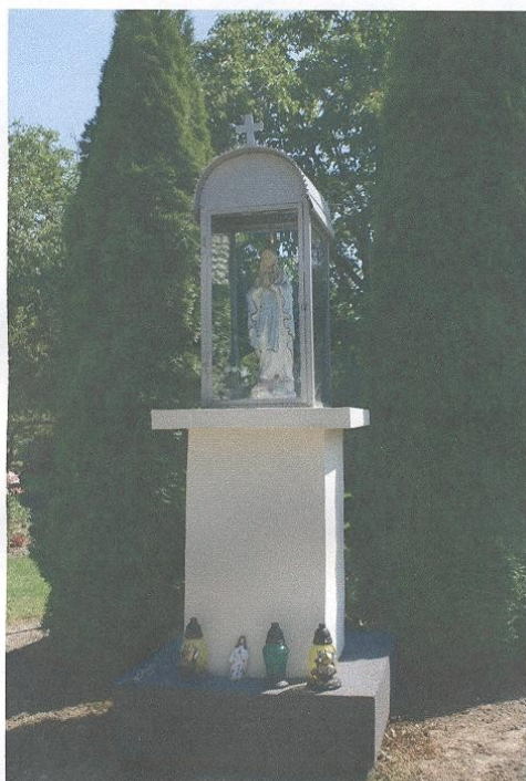
Kapliczka przydrożna w miejscowości Krzywystok