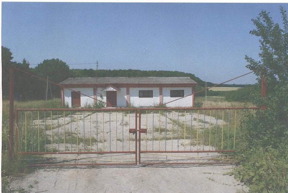
Budynek świetlicy wiejskiej w miejscowości Krzywystok - stan istniejący