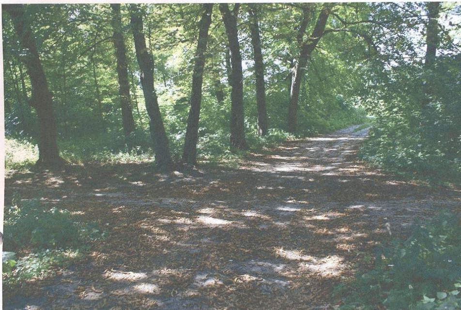
Pozostałości parku podworskiego w miejscowości Krzywystok