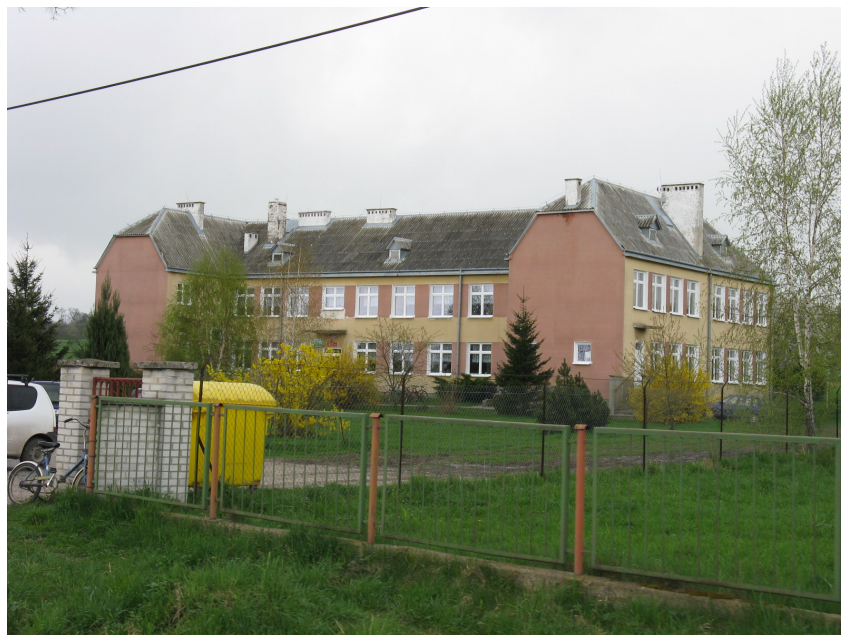
Budynek Szkoły Podstawowej i Gimnazjum Publicznego w Zubowicach