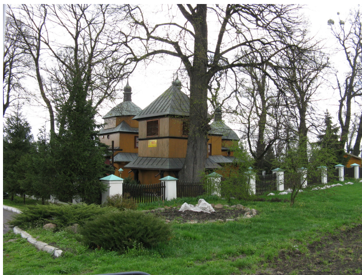
Kościół wpisany do rejestru zabytków