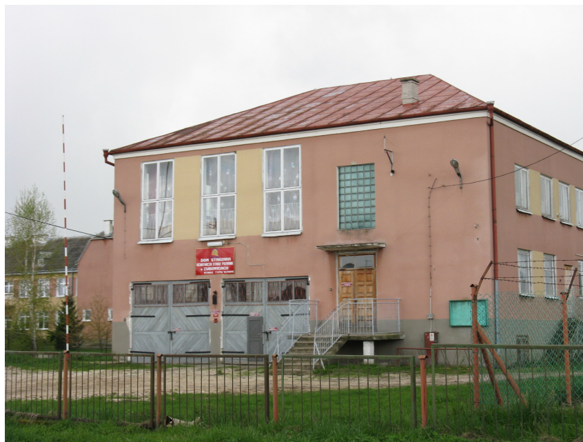
Budynek remizo-świetlicy w Zubowicach – stan istniejący

W miejscowości Zubowice istnieje wiele potrzeb związanych z wyposażeniem w infrastrukturę techniczną taką jak: kanalizacja, oświetlenie uliczne, sieć telefoniczna, które w miarę pozyskiwanych środków finansowych z zewnątrz będzie realizowana.