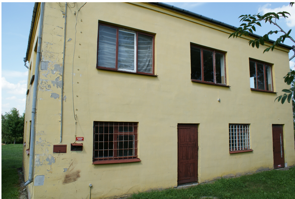
Budynek świetlicy wiejskiej w Wolicy Brzozowej stan istniejący