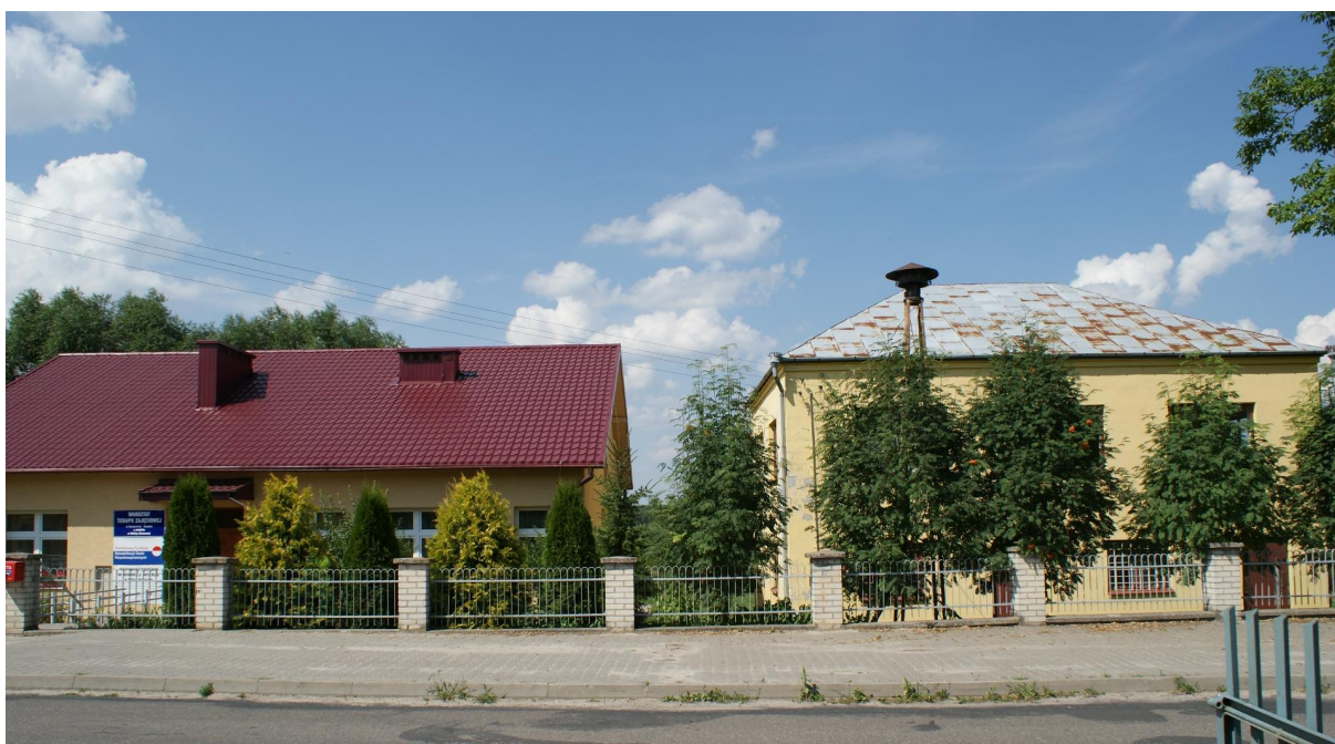
Funkcjonujący obiekt Warsztatu Terapii Zajęciowej w Wolicy Brzozowej